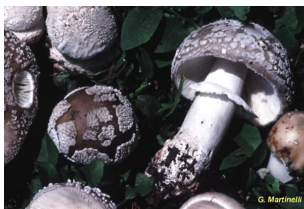
6. Amanite épaisse / Amanita spissa