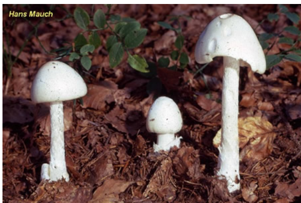
1. Amanite printanière / Amanita verna