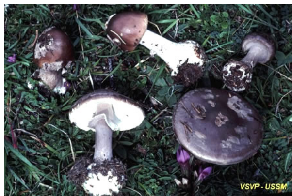
4. Amanite porphyre / Amanita porphyria