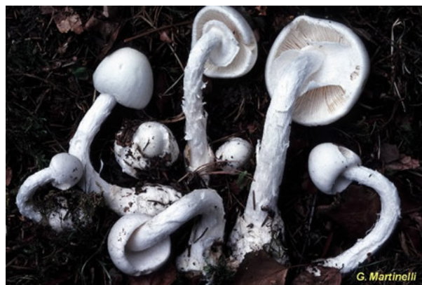
2. Amanite vireuse / Amanita virosa