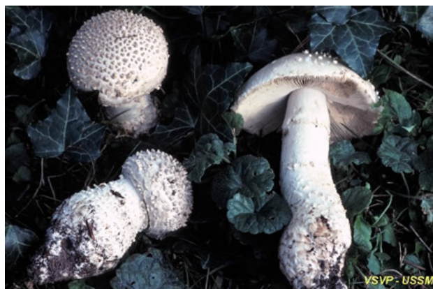
7. Amanite à chapeau épineux / Amanita echinocephala