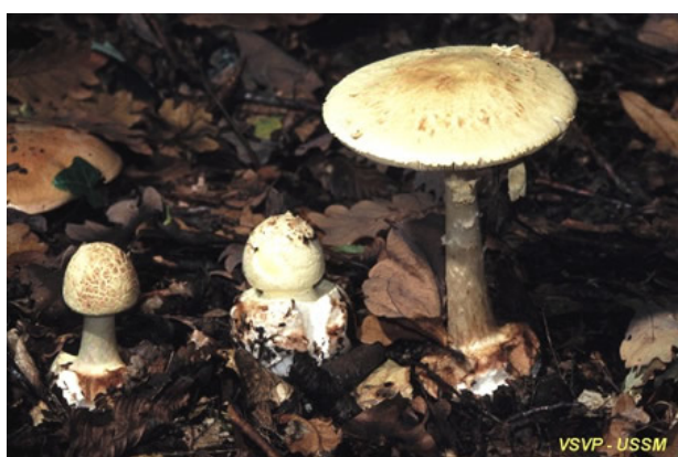
5. Amanite citrine / Amanita citrina