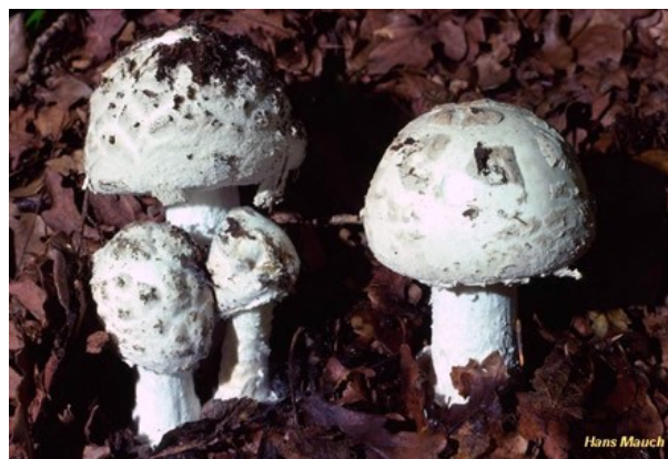
8. Amanite pomme de pin / Amanita strobiliformis