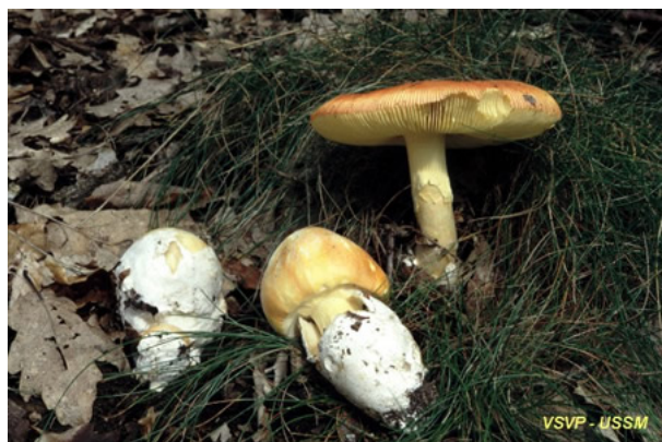
3. Amanite des Césars / Amanita caesarea